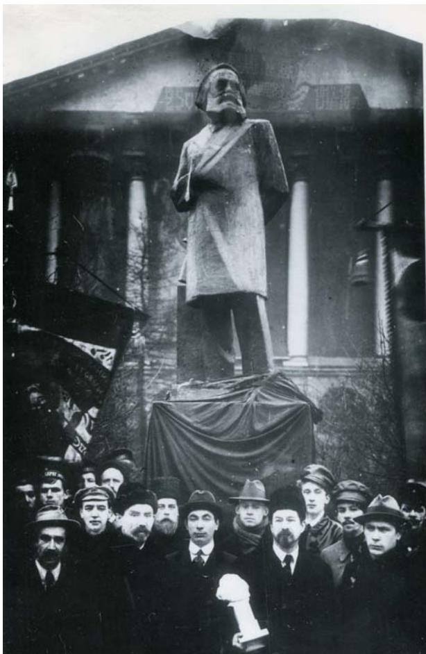
Рис. 1. Открытие памятника К. Марксу перед зданием Смольного института 7 ноября 1918 г. Скульптор А. Т. Матвеев

решение оставалось на усмотрение городских властей.