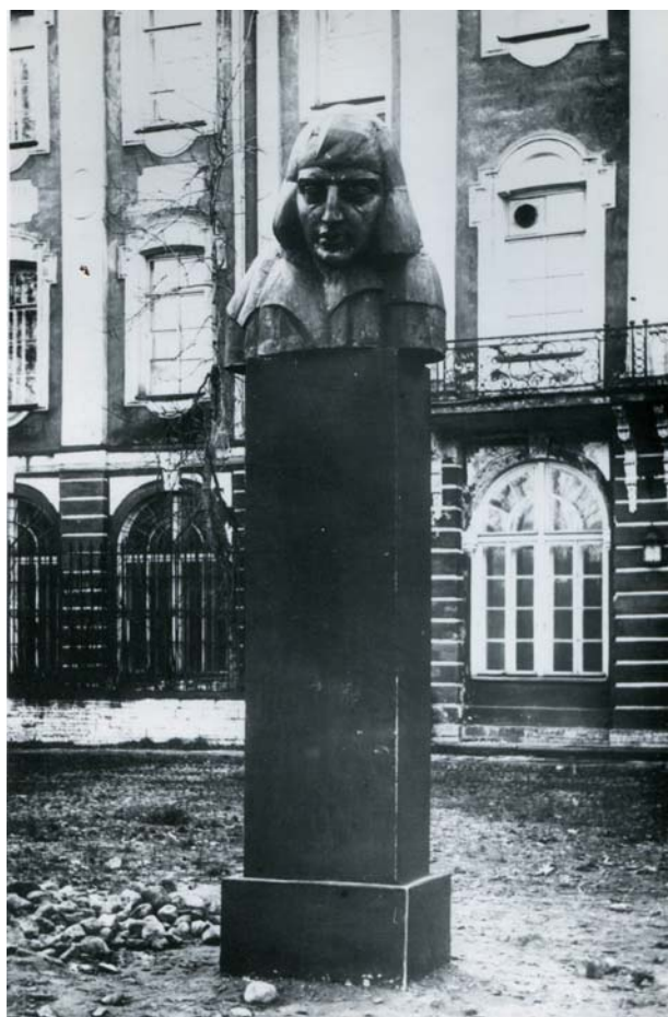
Рис. 4. Памятник Г. Гейне перед главным фасадом здания 12 коллегий на Менделеевской линии В. О. 1918 г. Скульптор В. А. Синайский

оружия и формировании российской культуры. Но и этого показалось недостаточным.