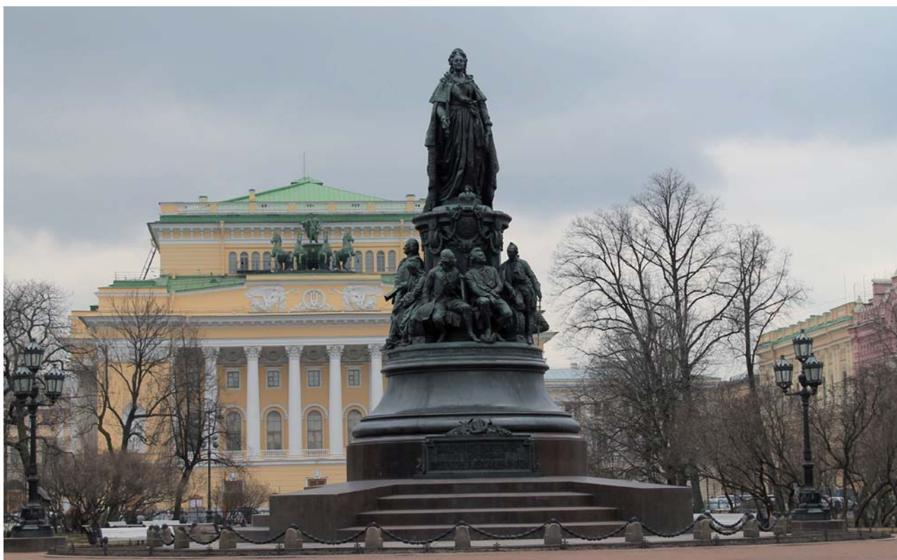
Рис. 7. Монумент Екатерине Великой в Санкт-Петербурге на пл. Островского. 1873 г. Скульпторы М. О. Микешин, А. М. Опекушин, М. А. Чижов; арх. Д. И. Grimm, В. А. Шретер

Следом идет группа «Государственные деятели», состоящая из 26 фигур. Это великие князья