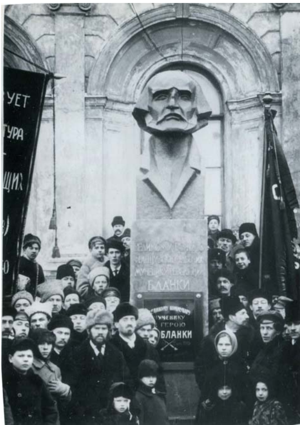
Рис. 5. Открытие памятника О. Бланки перед зданием Балтийского вокзала. 1919 г. Скульптор Т. Залькалн

князю Долгорукову-Крымскому; графу И. Е. Ферзену; графу В. А. Зубову; генерал-губернатору М. Н. Волконскому; губернатору Я. Е. Сиверсу; дипломату Я. И. Булгакову; графу П. И. Панину; генералам П. Д. Еропкину и И. И. Михельсону). Эта скульптурно-монументальная идея обсуждалась вплоть до 1894 г., но так и не была осуществлена [7, с. 140–145].