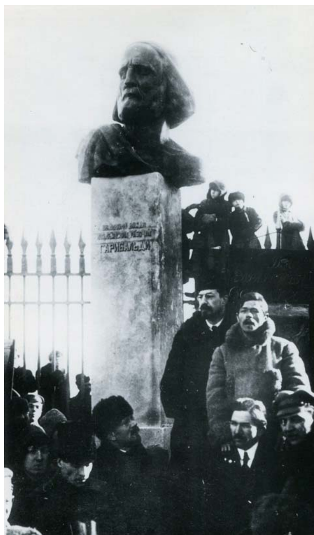
Рис. 6. Открытие памятника Д. Гарибальди на Международном (совр. Московском) проспекте. 1919 г. Скульптор Т. Залькалн. На фото представители III Международного Интернационала; справа от постамента (в центре) — нарком просвещения А. В. Луначарский [4, с. 21]

символизирующую Россию; ниже, у подножия «государственной державы», размещены 17 «колоссальных фигур», изображающих главные исторические персоны тысячелетней российской истории; еще ниже, на пьедестале, расположен единый скульптурный горельефный фриз, объединивший изображения 109 исторических фигур — государственных деятелей, церковных иерархов, военных, писателей, художников и т. д. Все фигуры появились на монументе в результате многоэтапного, внимательного и тщательного отбора. При этом многие исторические персоны, первоначально заявленные в предварительный