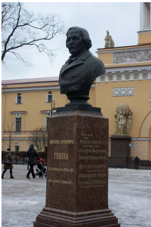
Рис. 9. Бюст М. И. Глинки в Александровском саду Санкт-Петербурга. 1899 г. Скульптор В. П. Пащенко, арх. А. С. Лыткин

Н. В. Гоголя (1896 г., скульптор В. П. Крейтан, арх. Н. В. Максимов), бюст М. Ю. Лермонтова (1896 г., скульптор В. П. Крейтан, арх. Н. В. Максимов), бюст М. И. Глинки (1899 г., скульптор В. М. Пащенко, арх. А. С. Лыткин) (рис. 9); в 1911 г. было предложено установить и бюст В. Г. Белинского (не осуществлено) [7, с. 50–51].