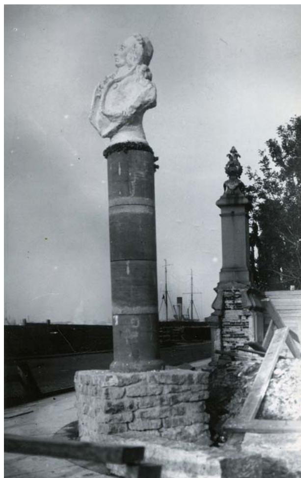
Рис. 2. Памятник А. Н. Радищеву в проломе ограды Собственного сада Зимнего дворца. 1918 г. Скульптор Л. В. Шервуд

В те же годы, параллельно с окончательным отказом от идеи воздвижения монументальной галереи правителей страны вдоль набережных Екатерининского канала, возникла мысль сопроводить установку монумента Екатерине Великой перед Александринским театром целой галереей скульптур и бюстов выдающихся деятелей эпохи правления этой блистательной императрицы (рис. 7). Пьедестал открытого