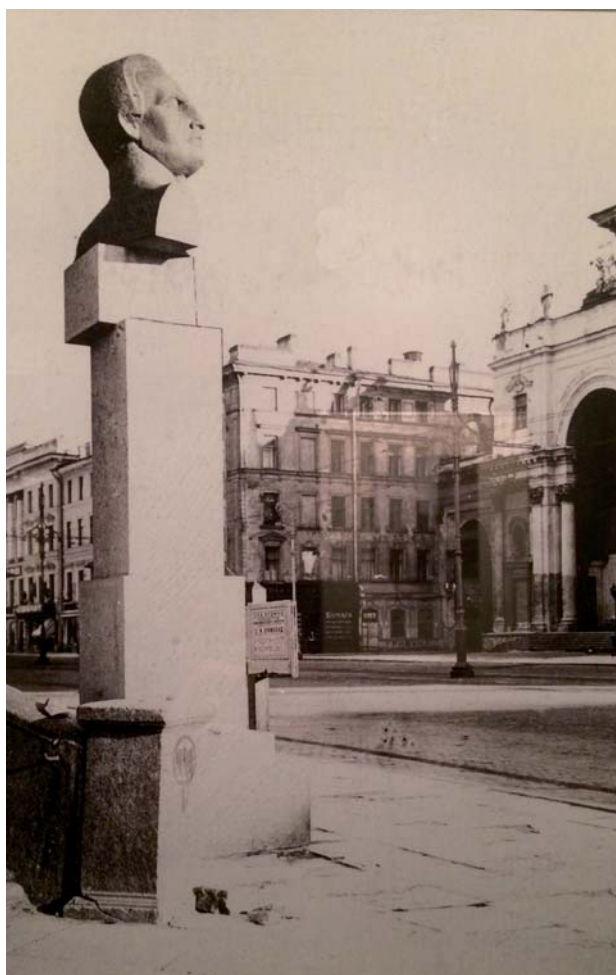
Рис. 3. Памятник Ф. Лассалю на пр. 25 Октября (совр. Невский пр.) у здания бывш. Городской думы (1918–1939 гг.). Скульптор В. А. Синайский

в 1873 г. монумента на пл. Александринско-го театра (совр. пл. Островского, скульптор М. О. Микешин) содержал девять бронзовых фигур главных государственных деятелей той эпохи (работы скульптора А. М. Опекушина): фельдмаршалов П. А. Румянцева-Задунайского, Г. А. Потемкина-Таврического, А. В. Суворова-Рымникского; министра и поэта Г. Р. Державина; президента Российской академии Е. Р. Дашковой; князя А. А. Безбородко; президента Российской академии художеств И. И. Бецкого; адмиралов В. Я. Чичагова, А. Г. Орлова-Чесменского. Каждая из этих исторических личностей оставила грандиозный след в развитии Российского государства, становлении и совершенствовании государственного управления, проведении реформ армии и флота, в великопленных победах русского