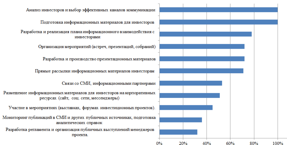
Рис.3. IR функции на посевной стадии, стадии роста и экспансии проекта

России IR-менеджеров). По ограниченному количеству размещенных узкоспециализированных IR-вакансий можно сделать вывод, что зачастую инвесторов объединяют с другими группами общественности, с которыми работают PR-менеджеры.