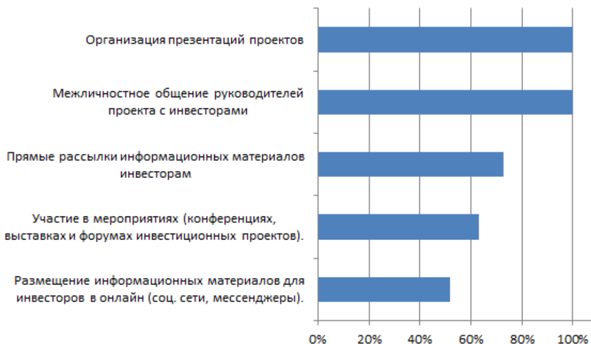
Рис.2. IR функции на предпосевной стадии развития проекта

На предпосевной стадии у большинства инициаторов проектов IR функции ограничены, т.к. недостаточно кадровых и финансовых ресурсов. Для сбора аналитической информации по используемым каналам коммуникации с инвесторами на ранних стадиях реализации проекта проводились опросы руководителей IT стартапов в 2019-2020 годах.